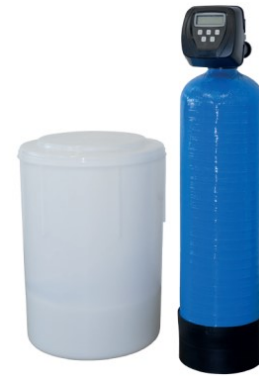
Grafik 1: IAT EH solo 9

Wenn wir allgemein von „Wasser“ sprechen, meinen wir in der Regel Wasser, das neben den Wassermolekülen auch sichtbare oder nicht-sichtbare Bestandteile enthält. So finden sich im Wasser gelöste Ionen, Mineralien, Salze und Gase , die zusammen den Gesamtsalzgehalt sowie, durch die verschiedenen Ladungen, die elektrische Leitfähigkeit des Wassers bestimmen. Ein Ionenaustauscherstoff ist in der Lage, die gewünschten Ionen (positiv oder negativ geladene Teilchen) aus dem umgebenden Medium aufzunehmen und durch andere Ionen zu ersetzen.